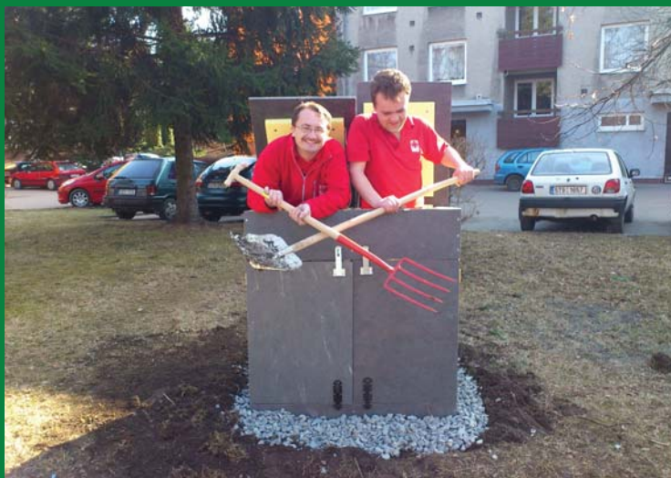
Instalace komunitního kompostéru v MC Klubičko, Frenštát pod Radhoštěm