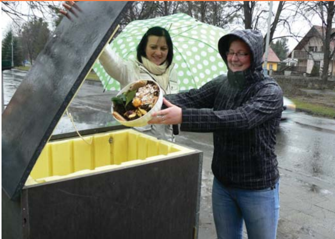
Slavnostní zahájení komunitního kompostování v MC Klubičko, Frenštát p. R. a v RC Majáček, Havířov