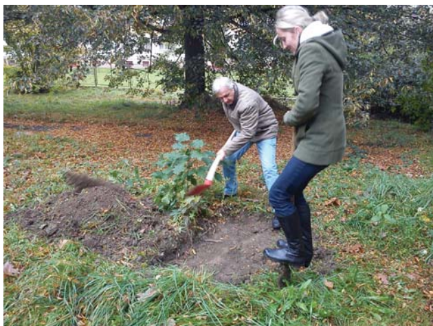
Instalace komunitního kompostéru v RC Majáček, Havířov