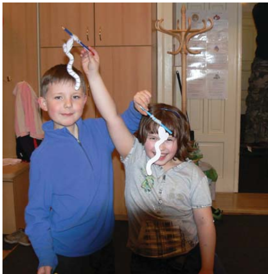
Doprovodný program pro rodiče s dětmi při slavnostním zahájení v MC Klubičko, Frenštát p. R. a v MC Krteček, Ostrava-Poruba