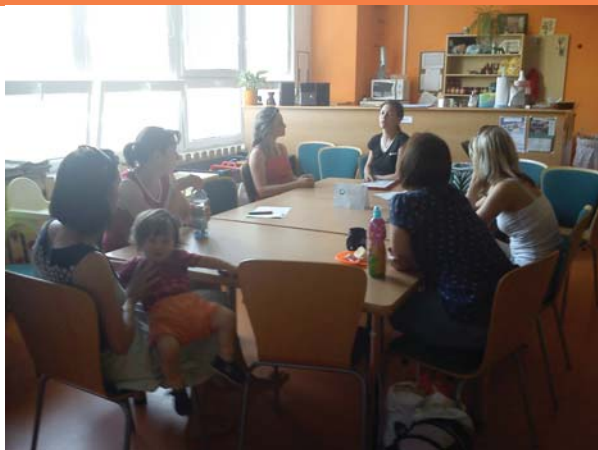
Informační setkání v MC Krteček, Ostrava-Poruba