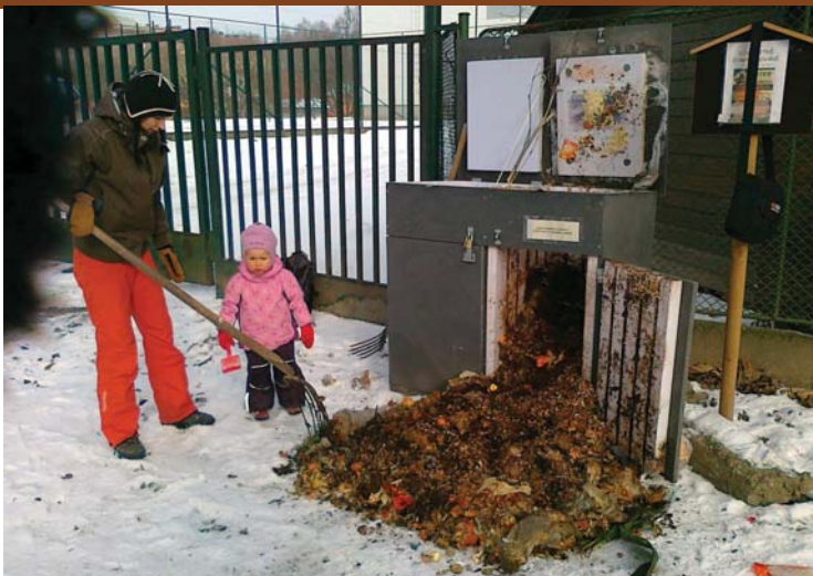
Přeházení vznikajícího kompostu a kontrola průběhu kompostování, MŠ Čs. exilu, Ostrava-Poruba