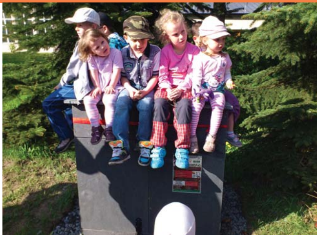
Slavnostní zahájení komunitního kompostování, MC Krteček, Ostrava- Poruba