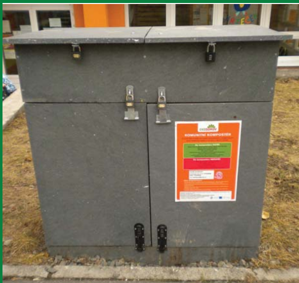
Komunitní kompostér MC Krteček, Ostrava-Poruba

bezproblémového provozu komunitního kompostéru, který nelze tak jednoduše přemístit, ale také sniží zájem občanů (především klientů a návštěvníků mateřských center) separovat biologický odpad, protože kompostér již nemají „po ruce“.