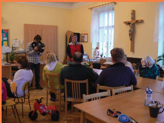
Informační setkání v MC Klubičko, Frenštát p.R.