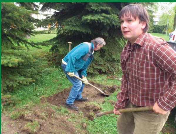
Instalace komunitního kompostéru v KM Broučci, Frýdek-Místek